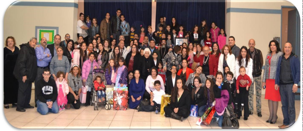
The Congregation of Saint Mary Church at the annual Sunday School New Year Plays

شعب كنيسة العذراء يوم الإحتفال السنوي بتمثيلات اولاد وبنات مدراس الأحد