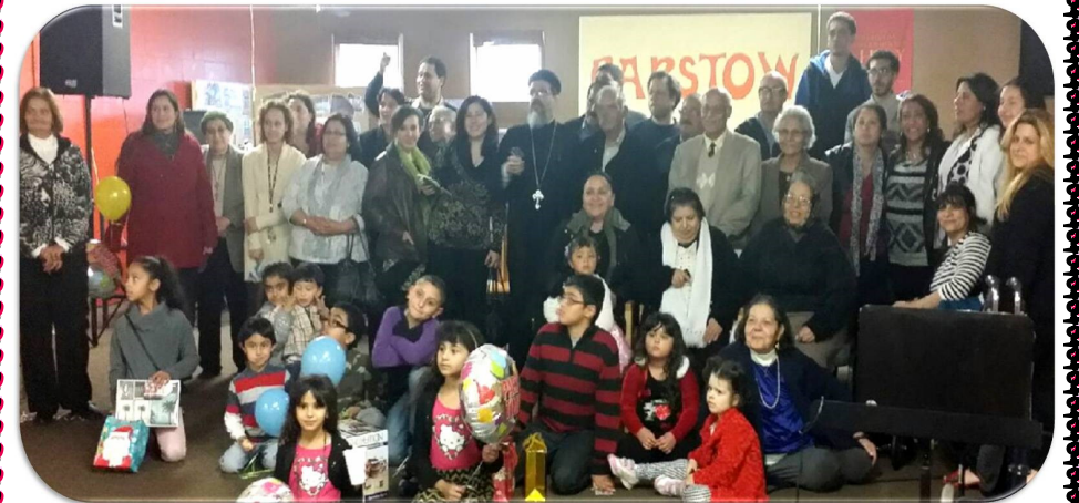
The Church Congregation at Barstow Celebrating The First Anniversary of The Church

شعب كنيسة العذراء يوم الإحتفال السنوي بتمثيلات اولاد وبنات مدراس الأحد