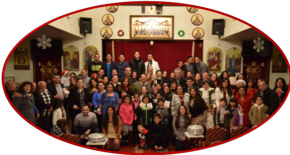
The Congregation Celebrating New Year's Eve

جميع الشعب والشعب المسيحي في العالم بعيد الميلاد المجيد والعام الجديد.