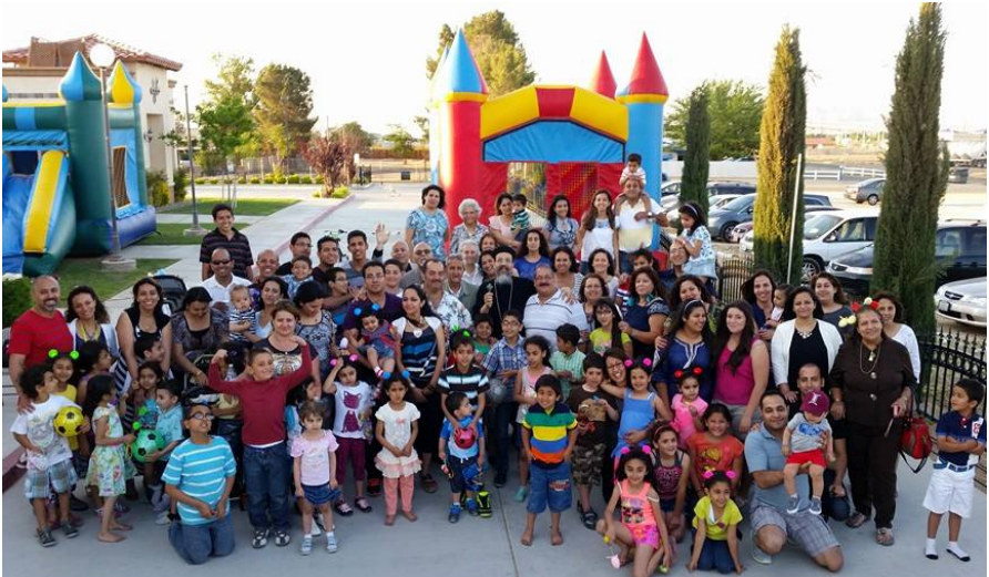
صورة الاحتفال بعيد القيامة المجيد يوم الأحد ٢٠ ابريل في الكنيسة

✠ تقوم الكنيسة بالاحتفال بعيد الأم يوم الأحد الموافق ١١ مايو في ميسا ليندا بارك.