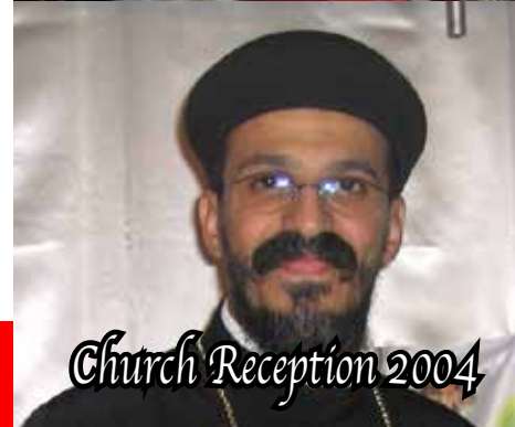
Church Reception 2004