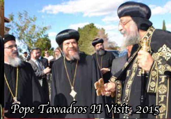
Pope Tawadros II Visit 2015