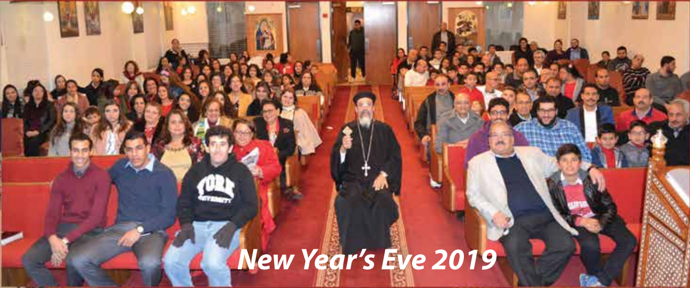
New Year's Eve 2019