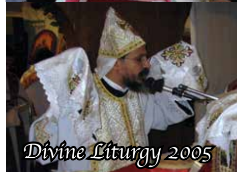
Divine Liturgy 2005