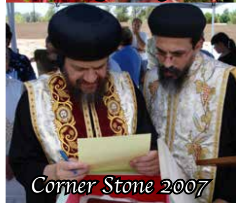
Corner Stone 2007