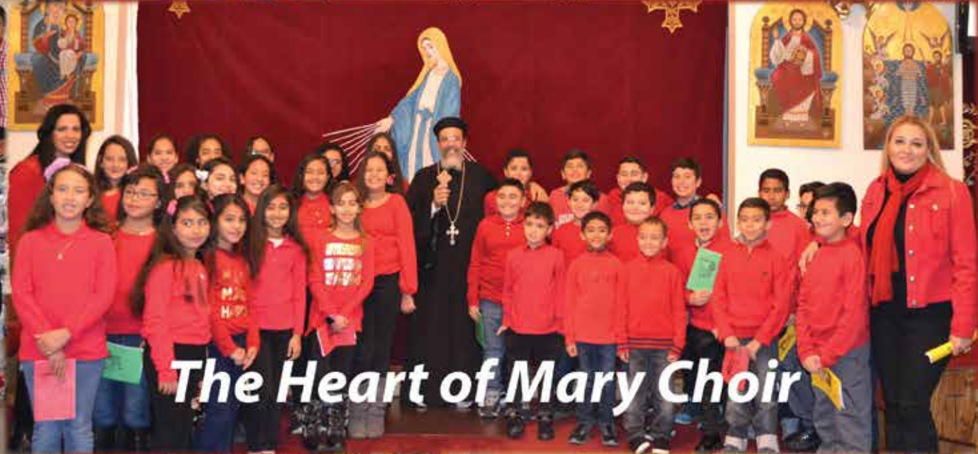
The Heart of Mary Choir