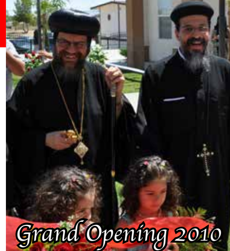
Grand Opening 2010